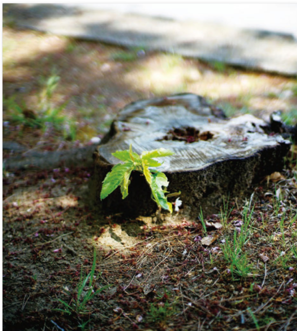
「ダビデのひこばえ」